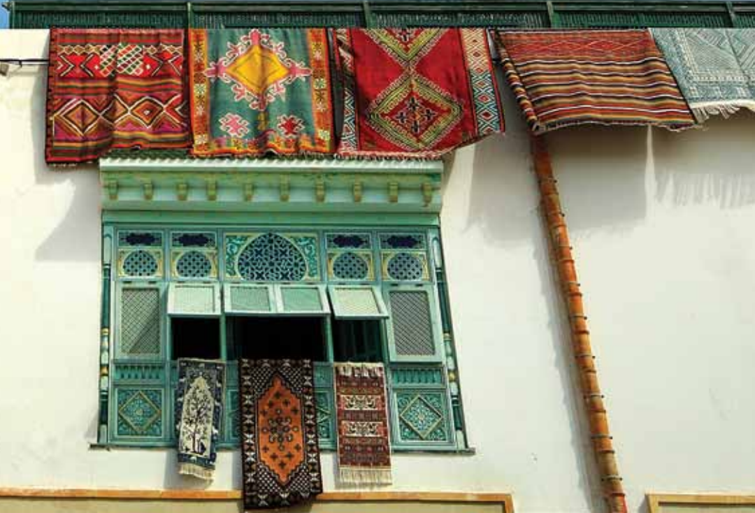
أحد محلات بيع الكليم في مدينة المهديّة، تونس.

المؤسسات الخاصة التي تقودها الطبقة المتوسطة الوليدة هي مفتاح نجاح التحول الديمقراطي في الشرق الأوسط