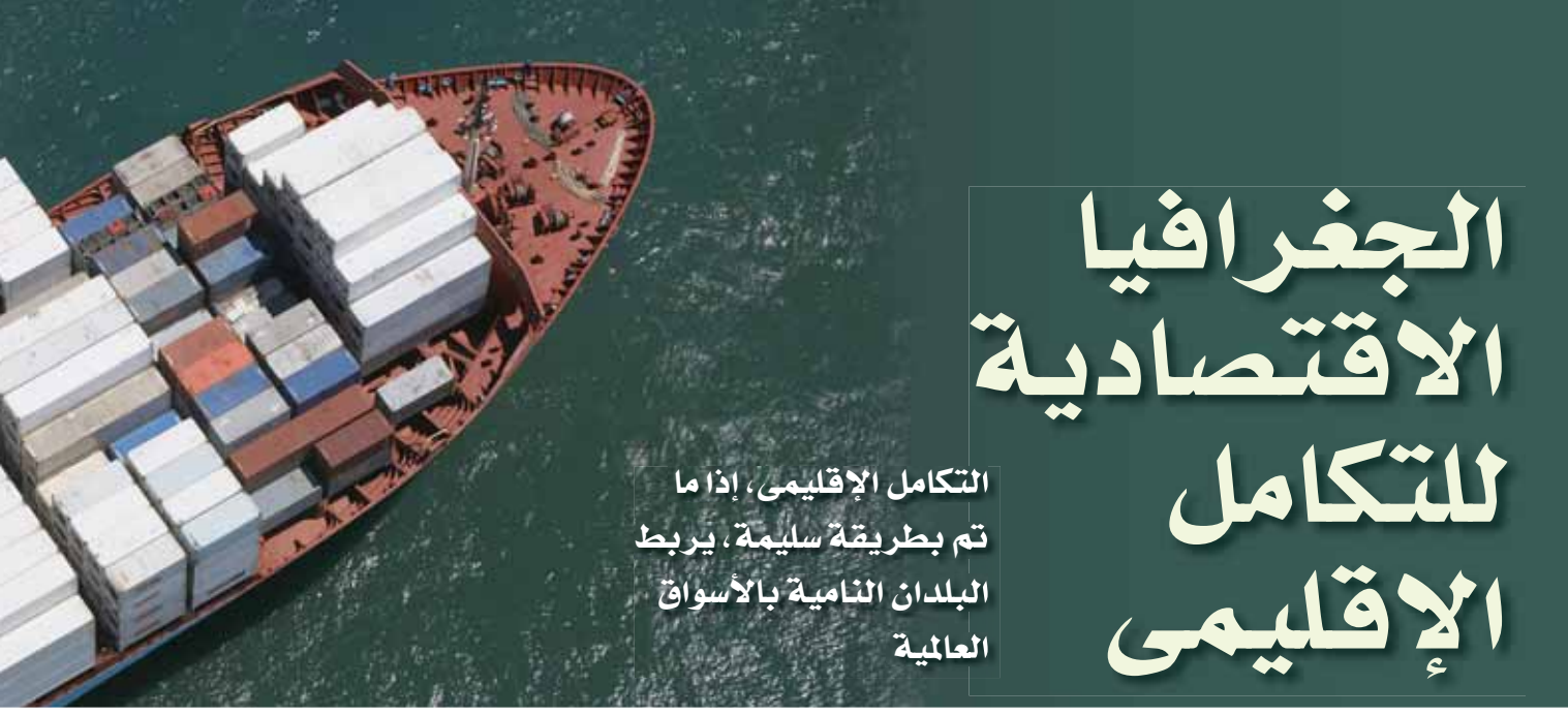
سفينة حاويات بالقرب من ساحل البرازيل.