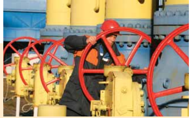
عامل من بيلاروسيا يؤدي عمله في خط أنابيب يامال-أوروبا

وإلى جانب الأموال الجديدة المقدمة من اليابان، يتوافر للصندوق نحو ٢٠٠ مليار دولار موارد قابلة للإقراض. ويسعى مدير الصندوق دومنيك ستراوس-كاهن، إلى دعم الأموال القابلة للإقراض المتوافرة للصندوق لتبلغ نحو ٥٠٠ مليار دولار، سواء كاحتياطي في حالة إن زادت الأزمة سوءاً وكإعادة تأمين يستطيع الصندوق بها مواجهة أي احتمال. وينظر مجلس إدارة الصندوق في عدد من الأساليب اللازمة لتعزيز موارد الصندوق، بما في ذلك تدعيم موارده الميسرة المقدمة للبلدان الأكثر فقراً.