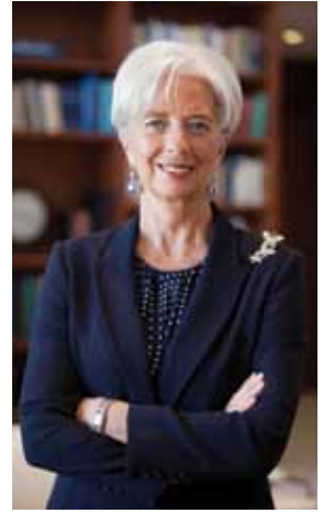
كريستين لاغارد مدير عام صندوق النقد الدولي.

عقب الصراع الذي شهدناه في السنوات الخمس الماضية وعمق واتساع الأزمة — التي وقعت جزئياً