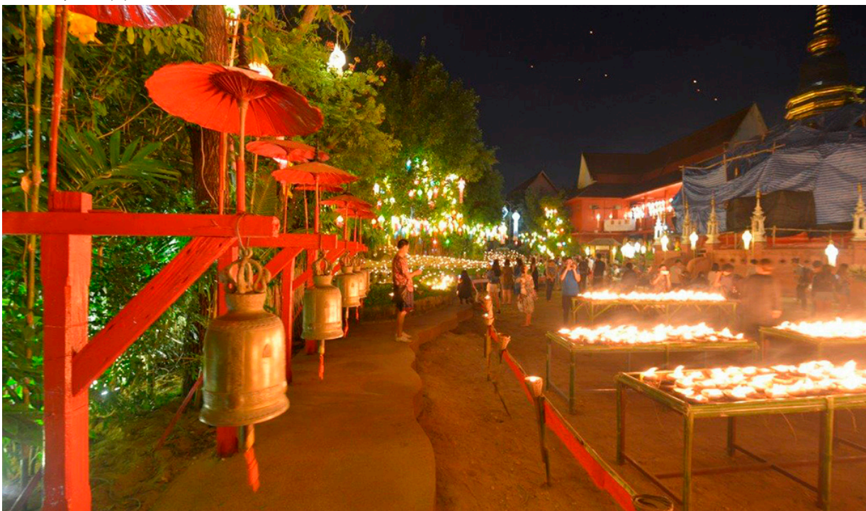
泰国清迈的水灯节：地区融资安排（例如，清迈倡议）在危机防范方面发挥着越来越大的作用

十年前，在 全球金融安全网 中，地区融资安排发挥的作用有限。不过，全球金融危机彻底改变了这一格局。各国政府达成了各项新的安排，例如，欧洲稳定机制和清迈倡议多边化，而且在 2007 年至 2016 年期间，全球金融安全网的资源增至原有规模的三倍。由于这一发展，加之 绸缪宜趁未雨时 ，基金组织与各地区安排之间开展有效、高效的协作已成为防范和缓解世界许多地方危机的关键。