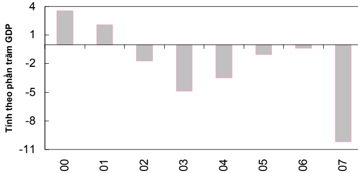
Đồ thị 3 Chênh lệch đang tăng lên Thâm hụt cán cân vãng lai của Việt Nam tăng lên hơn 10 phần trăm GDP trong năm ngoái