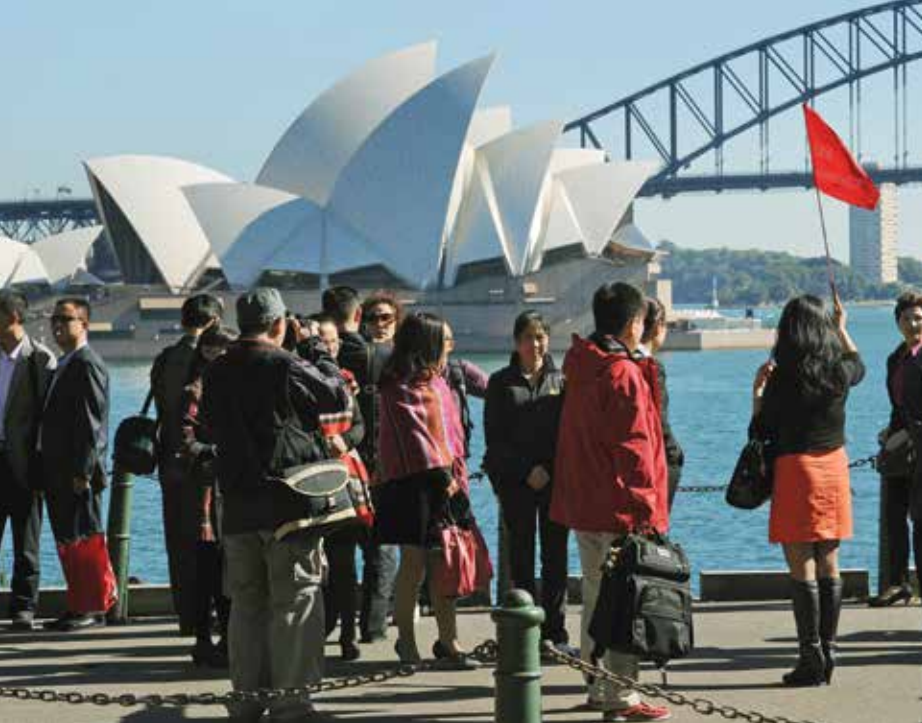
Turistas asiáticos de visita en Sídney, Australia.