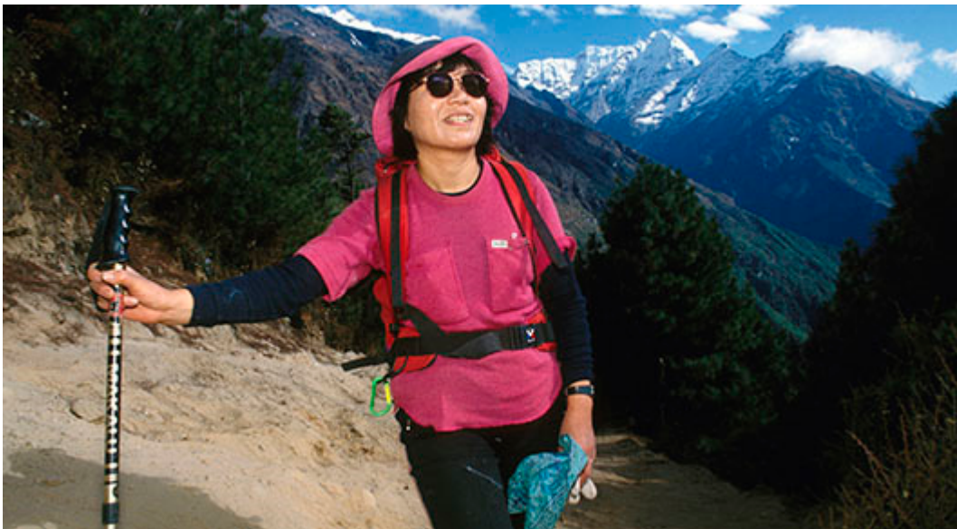
Дзюнко Табэи, первая женщина, которая покорила Эверест и «семь вершин» – самых высоких горных пиков на семи континентах.

Как известно, предоставление женщинам экономических прав и возможностей уже давно является одной из приоритетных задач международного сообщества. Группа шести (изначально Группа состояла из шести стран) была создана в 1975 году, который был провозглашен ООН «Международным годом женщины», с тем чтобы содействовать женщинам во всем мире в реализации их потенциала в полной мере. Альпинистка Дзюнко Табэи убедительно продемонстрировала этот потенциал, став первой женщиной, покорившей в том году Эверест. Однако в условиях, когда мир преодолевал последствия первого нефтяного кризиса и отмены системы фиксированных валютных курсов, стабильность мировой экономики и реализация возможностей женщин редко обсуждались одновременно.