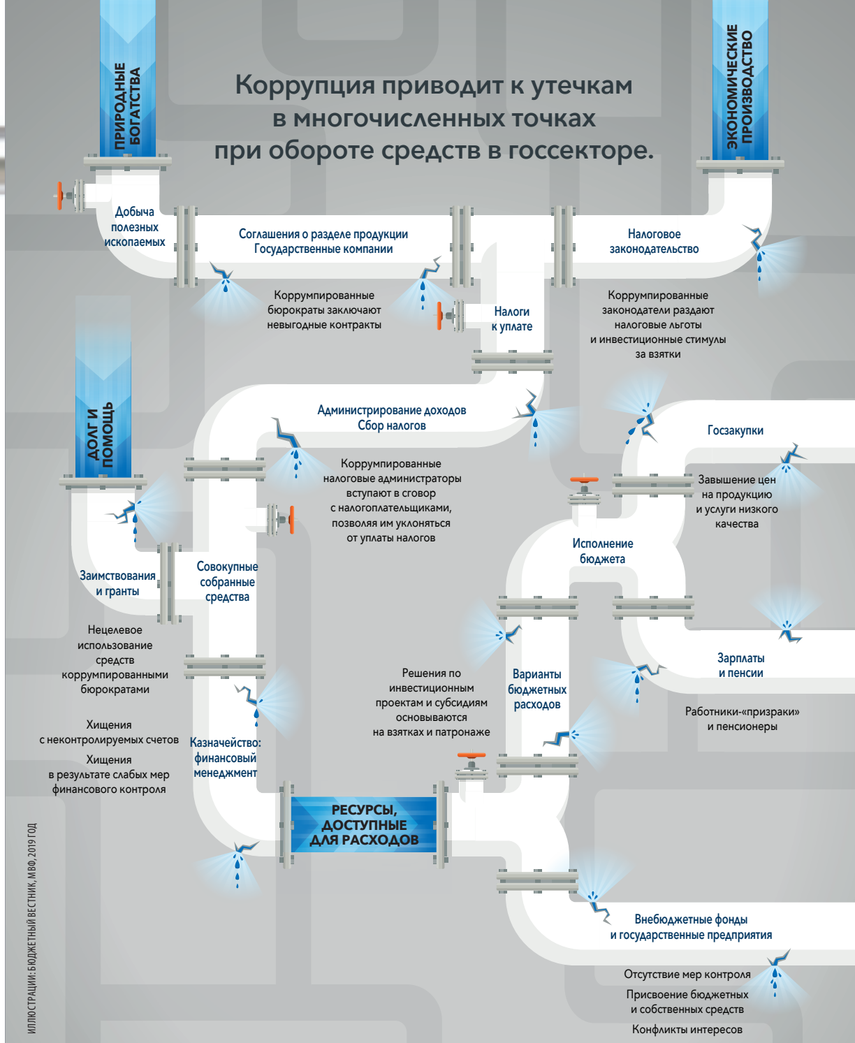
Иллюстрация: Бюджетный вестник, МВФ, 2019 год

родное сотрудничество. Более 40 государств ввели уголовное наказание для своих компаний за дачу взяток с целью получения заказов за рубежом. Страны также могут активно бороться с отмыванием денег и пресекать международные возможности для сокрытия средств коррупционного происхождения в непрозрачных финансовых центрах.