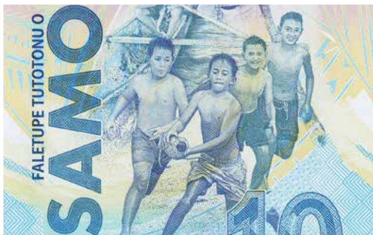
En 2019, le Samoa a mis en circulation un billet de 10 tala pour célébrer les Jeux du Pacifique, organisés par le pays. D'aucuns considèrent qu'il s'agit du premier billet neutre en carbone au monde.

de Malietoa Tanumafili II, chef de l'État du Samoa de 1962 à 2007, et de l'historique cathédrale catholique Mulivai.