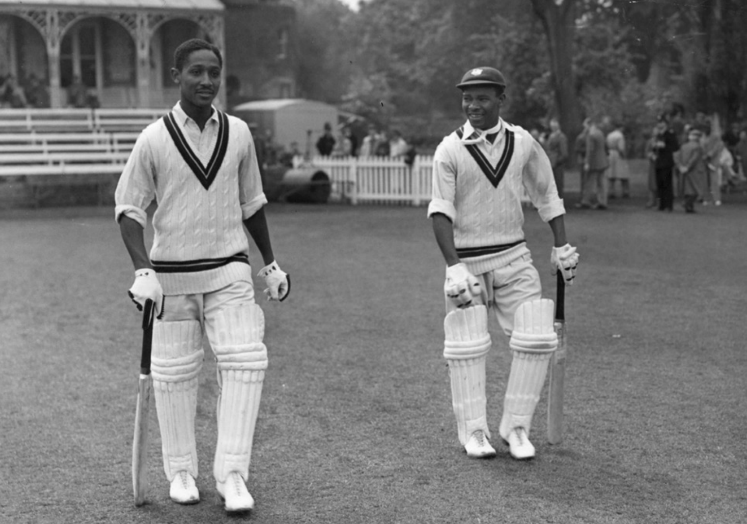
Las leyendas barbadenses del críquet, Frank Worrell (izquierda) y Everton Weekes (derecha), se disponen a batear en la Universidad de Cambridge en 1950.