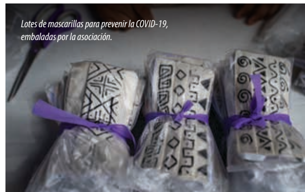
Lotes de mascarillas para prevenir la COVID-19, embaladas por la asociación.