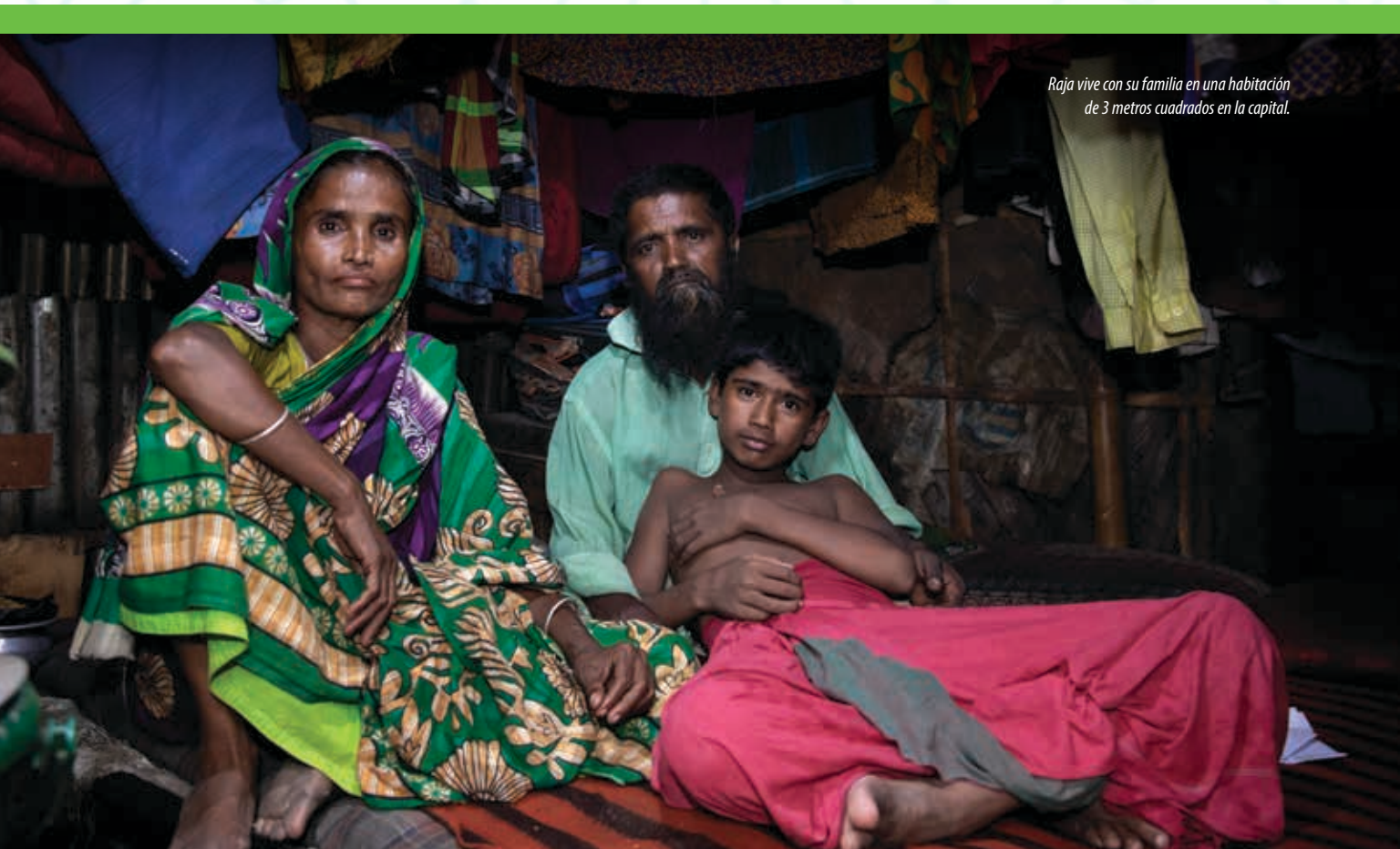
Raja vive con su familia en una habitación de 3 metros cuadrados en la capital.