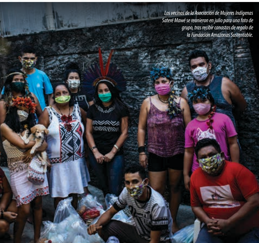
Los vecinos de la Asociación de Mujeres Indígenas Sateré Mawé se reunieron en julio para una foto de grupo, tras recibir canastas de regalo de la Fundación Amazonas Sustentable.