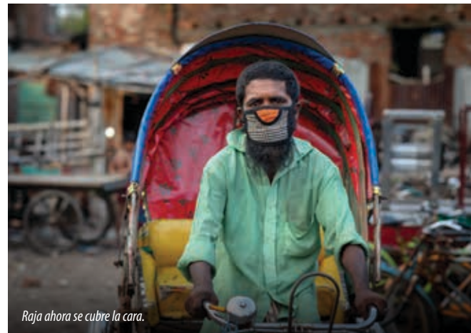
Raja ahora se cubre la cara.