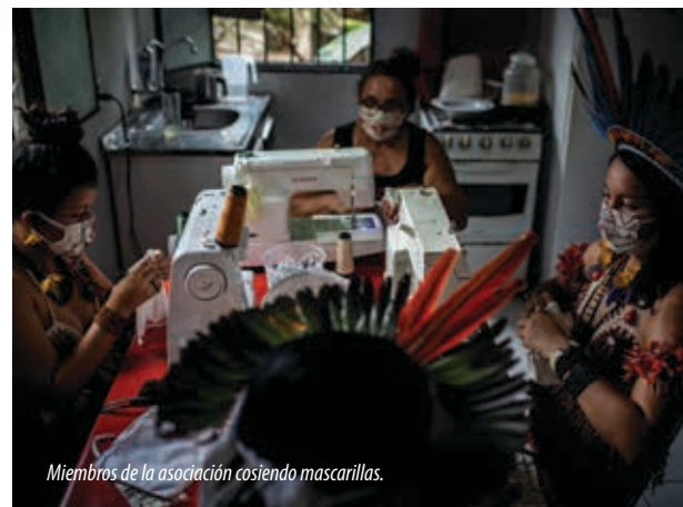
Miembros de la asociación cosiendo mascarillas.