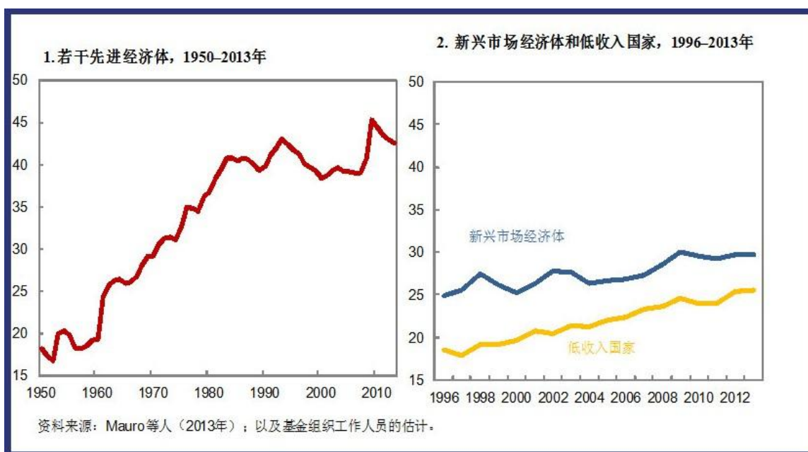
图1. 广义政府支出的向上趋势（占GDP的百分比）

19世纪的德国经济学家阿道夫·瓦格纳的理论认为，随着国家日益富裕，对公共产品和服务的需求会增加（“瓦格纳定律”）。威廉·鲍莫尔提供了另一种解释，即提供公共产品和服务成本增加的速度往往快于生产力提高的速度；他的例子是乐团的音乐家，哪怕其演奏水平并不比几十