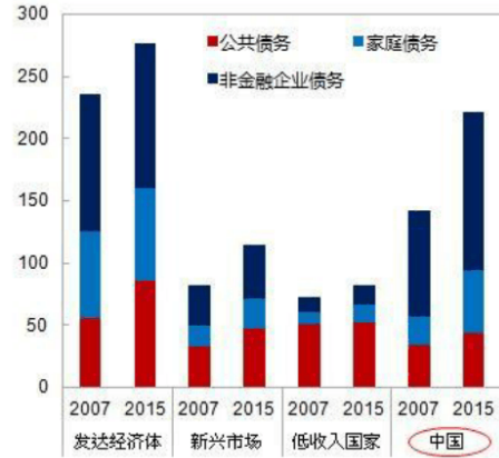
债务上升 中国的家庭和企业债务水平非常高，这给公共财政和经济带来风险。 (占GDP的百分比)

全球金融危机表明，公共财政所面临的巨大风险经常被低估。在发达经济体，救助破产银行和经济萧条深化导致公共债务达到和平时期前所未有的水平。各国政府应更好地了解所面临的风险，并采取管理风险的策略。中国的例子证明了审慎财政政策的重要性。在过去十年里，中国的债务增长非常快，甚至快于任何其他主要经济体。当局认识到有必要采取措施遏制债务快速累积，并降低金融风险。这是中国增长模式再平衡调整总过程的一部分。早日解决这些风险将改善中长期可持续发展的前景。在中国，财政政策可以在促进调整过程中发挥重要作用。在改善公共财政管理和各级政府关系方面已经采取重大措施或正在开展相关工作。