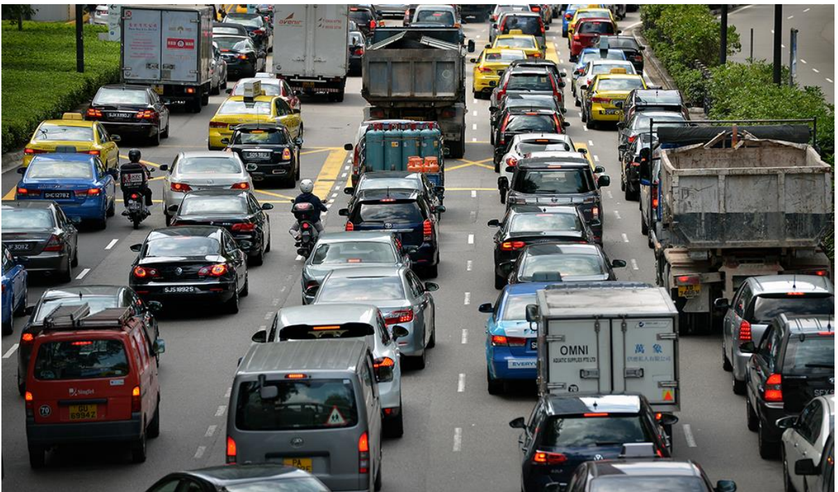
新加坡的交通：该城市使用数字技术确定公路收费，以此管理道路拥堵。

在卢旺达，数字监控的无人机向医院提供血液供给。在爱沙尼亚，纳税申报只需要 5 分钟的时间，而且 99% 的政府服务可以在线获得。新加坡成为第一个通过电子技术确定公路收费管理交通拥堵的城市。世界正变得日益数字化，动一下按钮即可获得可靠、及时和准确的信息。各国政府也在效仿数字化做法，将数字工具用于制定税收和支出政策、管理公共财政和提供公共服务。