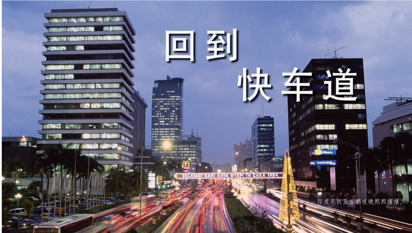
印度尼西亚首都夜晚熙熙攘攘。