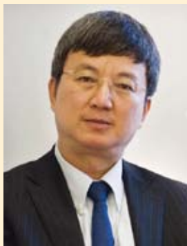
朱民，IMF总裁 特别顾问。

全球金融危机之后，全球经济“双速”复苏，全球经济增长力量正从发达经济体向新兴和发展中经济体转移。2010年，发达经济体的GDP平均增长3%，而新兴和发展中经济体则达到了7.2%。IMF预测这种复苏速度不平衡的状况还将继续。预计2011年发达经济体的增长速度为2%—2.5%，而新兴和发展中经济体的增长速度则为6%—6.5%。由此，新兴和发展中经济体也会成为消费增长的主要动力，今年，新兴和发展中经济体用于商品和服务的消费将比去年增长1.7万亿美元。