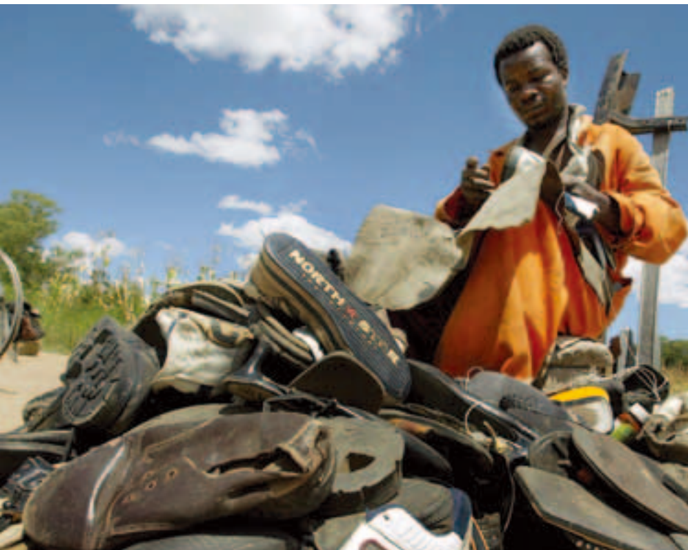
津巴布韦哈拉雷市路边的补鞋匠。