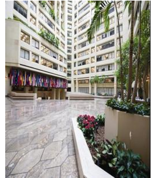
国際通貨基金本部