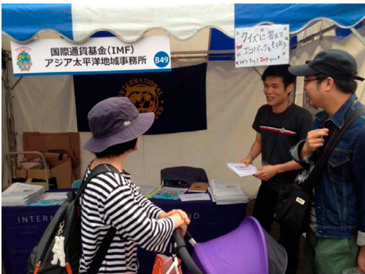
グローバルフェスタ2014にて

会場では作成した資料を使いながら、IMFの役割や歴史などを紹介しました。また、クイズに答えた方にはノベルティグッズをプレゼントするなど、多くの方に興味を持ってもらえるよう心がけました。