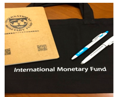
私が作成したIMFグッズです。

会場では作成した資料を使いながら、IMFの役割や歴史などを紹介しました。また、クイズに答えた方にはノベルティグッズをプレゼントするなど、多くの方に興味を持ってもらえるよう心がけました。