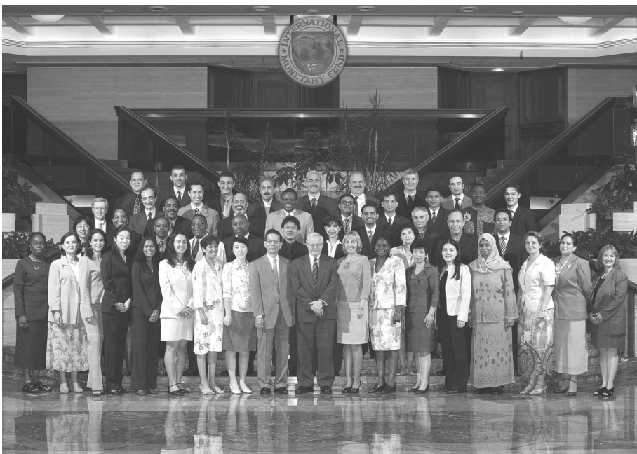
基金组织华盛顿总部首届外债统计培训班工作人员与学员合影（2005年7月）

技术援助项目时使用数据质量评估框架。例如，2005年7月在基金组织总部举办的培训课程中，学员将外债统计数据质量评估框架作为其培训资料。此外，可以通过评估外债统计的质量，帮助强化基金组织的业务工作。