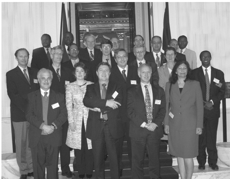
财政统计跨机构工作组中分别代表国际清算银行、英联邦秘书处、基金组织、经合组织、联合国贸发会议和世行的与会者在伦敦英联邦秘书处开会

计工作小组会议上作出的承诺，即研究在开发一个编制由各国当局提供的公共债务数据的综合框架方面的合作方式，基金组织开发并向会议提交了公共部门债务格式最初草稿，供其考虑。数据模块草稿是基于2001年《政府财政统计手册》、