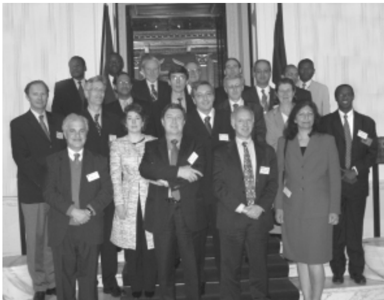
Члены ЦГСФ, представляющие БМР, Секретариат Содружества, МВФ, ОЭСР, ЮНКТАД и Всемирный банк, во время своего заседания в Секретариате Содружества в Лондоне.

После принятия на заседании МЦГСФ в мае 2004 года обязательства изучить методы сотрудни-