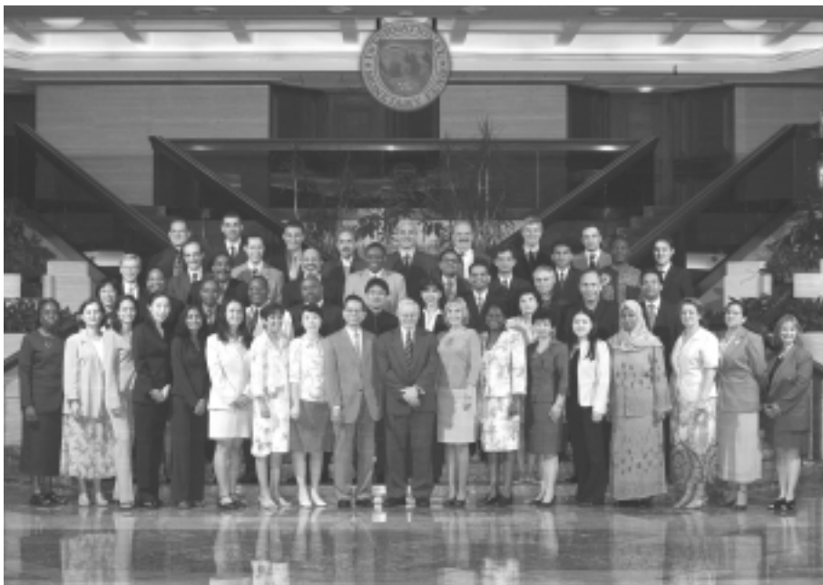
Участники и сотрудники на первом проводимом в штаб-квартире МВФ курсе по статистике внешнего долга в г. Вашингтон, округ Колумбия (июль 2005 года).