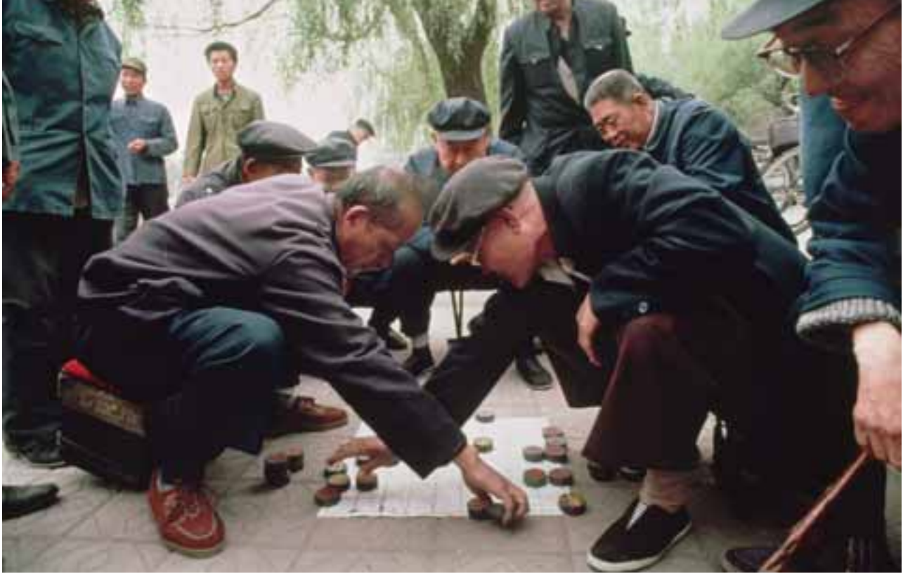
Jeu d'échecs à Beijing.

jeu sur l'ampleur des problèmes à venir. Le présent article évalue la préparation des pays d'Asie et analyse les aspects qu'ils devront considérer pour répondre aux exigences d'une population vieillissante.