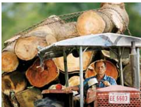
Une scierie à Rio Frio (Costa Rica), où un projet de pointe permet de transformer les déchets de l'industrie du bois en énergie.

Le rapport signale que la forte expansion des investissements vers l'Afrique tient en partie aux mesures prises par les pays pour ouvrir leurs économies au financement extérieur : réduction d'impôts, création de zones spéciales d'investissement, promotion des investissements, aide à la création d'entreprises et facilitation des procédures d'agrément. Mais certains pays ont pris des mesures moins favorables à l'investissement étranger : perception de redevances, extension de monopoles d'État, limitation des transferts d'argent et traitement préférentiel des nationaux.