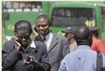
Utilisateurs de portables à Nairobi, Kenya : Un accord a été signé pour connecter toutes les grandes villes d'Afrique d'ici à 2012.

Le sommet, qui s'est tenu du 28 au 30 octobre, a réuni des institutions mondiales de développement, des entreprises de TI, cinq chefs d'État africains et plus de 50 ministres chargés des TI. Il fut annoncé à cette