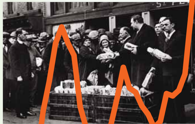
Distribution de pain à New York, en 1930.