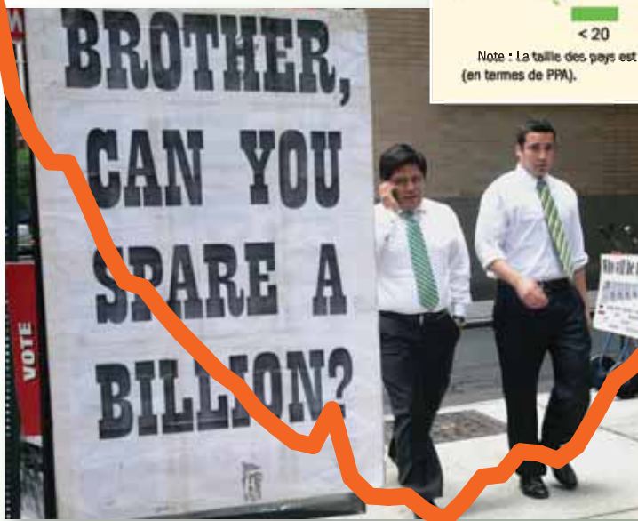
«Eh, tu n'aurais pas un milliard?», New York, 2008.

Pendant la crise des années 30, le ratio d'endettement a culminé à 80 % du PIB en 1932, après plusieurs épisodes de crises bancaires et monétaires. La fin de la crise, dans la seconde moitié des années 30, s'est accompagnée d'une baisse de la dette, mais la Seconde Guerre mondiale a mis fin au désendettement. Les emprunts massifs rendus nécessaires dans de nombreux pays par l'effort de guerre ont porté l'endettement des pays avancés au plus haut niveau enregistré dans la base de données, à savoir près de 150 % du PIB en 1946.