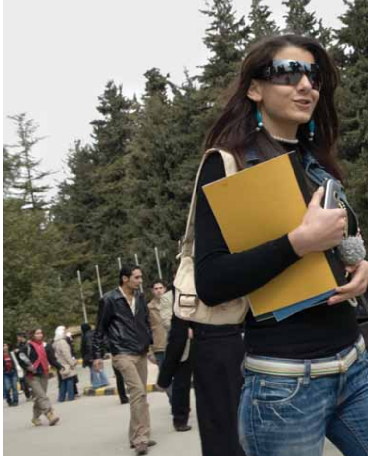
Étudiants à l'Université d'Amman, en Jordanie.

De tels taux de chômage induisent des coûts sociaux et économiques notables. Il y a eu une forte émigration, en partie à cause des perspectives d'emploi limitées dans ces pays et on estime le