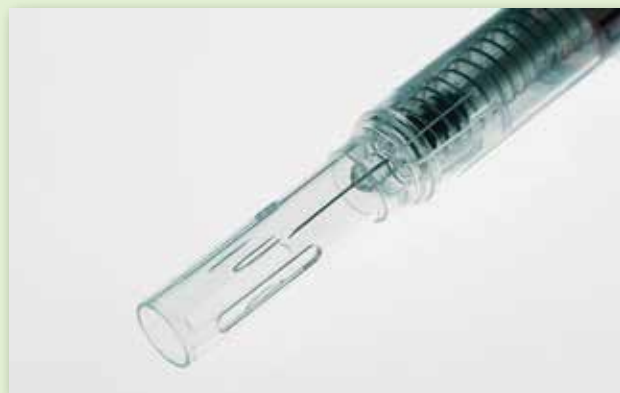
Les seringues «intelligentes» empêchent la réutilisation et l'infection.

L'OMS exhorte les pays à utiliser exclusivement les seringues intelligentes d'ici 2020, sauf, par exemple, quand l'utilisation