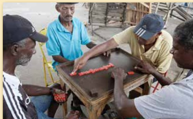
Joueurs de dominos à Santo Amaro, au Brésil.

De nombreux pays de la région ne disposent pas encore de système ni de capacités institutionnelles pour bien gérer les régimes de retraite (contributifs et non contributifs). Il est donc important d'investir davantage dans les systèmes et de réformer les dispositifs institutionnels pour accroître la couverture et la viabilité des retraites.