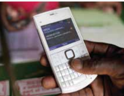
Transfert d'argent par téléphone mobile, Nairobi, au Kenya.

Ces cinq dernières années, 700 millions de personnes ont ouvert leur premier compte auprès d'une banque, d'un autre établissement financier ou d'un fournisseur de services mobiles, et le nombre de personnes sans compte bancaire a baissé de 20 % pour atteindre 2 milliards, selon Global Findex, un rapport de 2014 de la Banque mondiale.