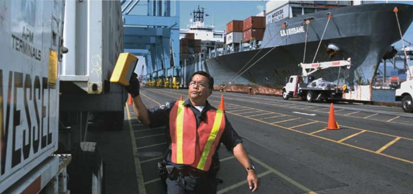
Сотрудник таможенной службы США осматривает контейнеры в порту Лонг-Бич, Калифорния.

точной стоимости импорта и мониторинг неправомерного использования налоговых льгот, носят бессистемный характер и применяются непо-следовательно. Полномасштабному обмену информацией и сотрудничеству с другими государственными органами, в том числе со службами внутренних налогов, препятствуют бюрократические процедуры.