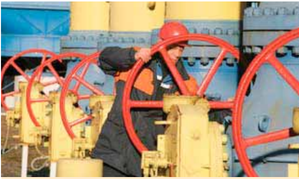
Белорусский рабочий на трубопроводе «Ямал-Европа».