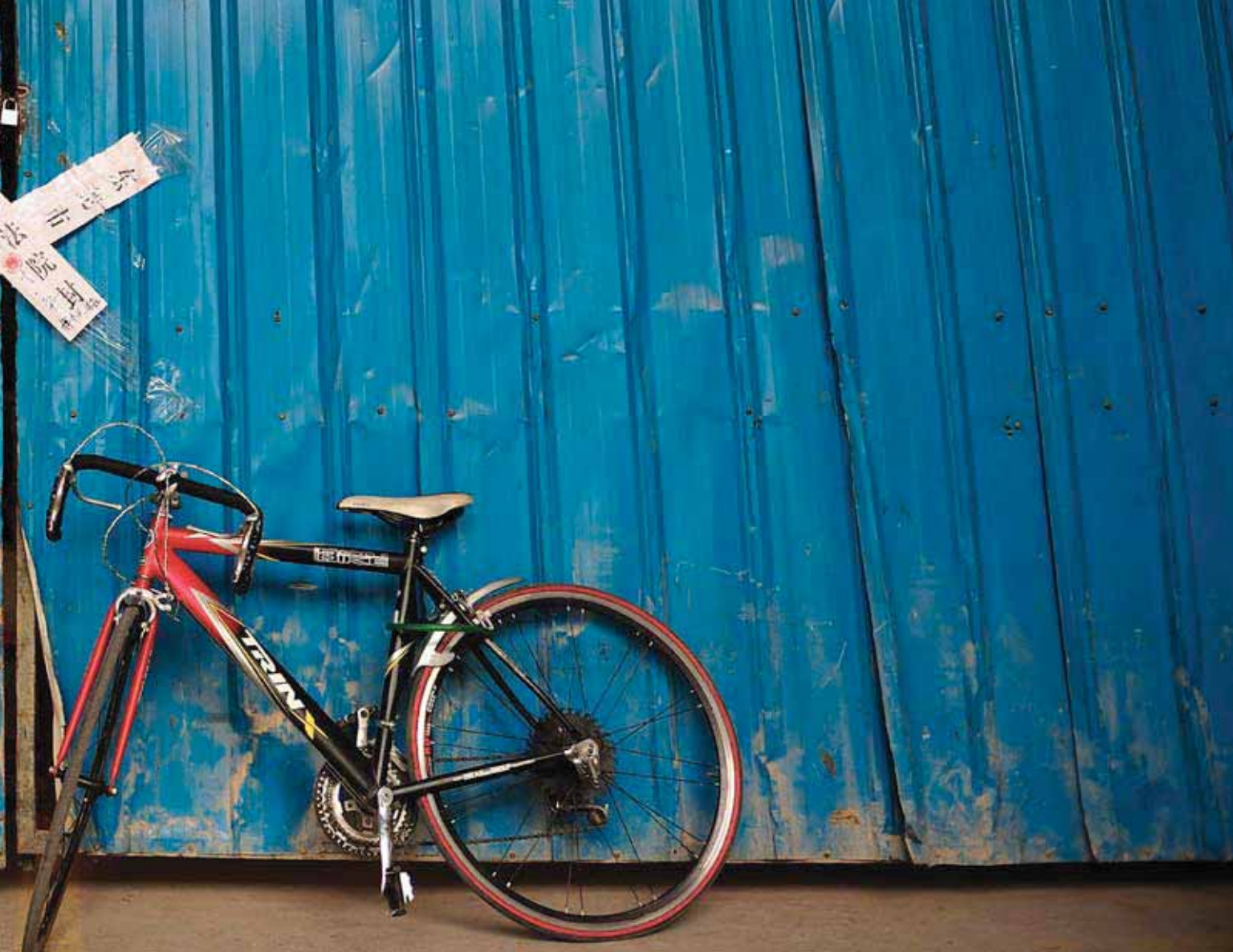
Опечатанное предприятие в Донггуане, Китай.