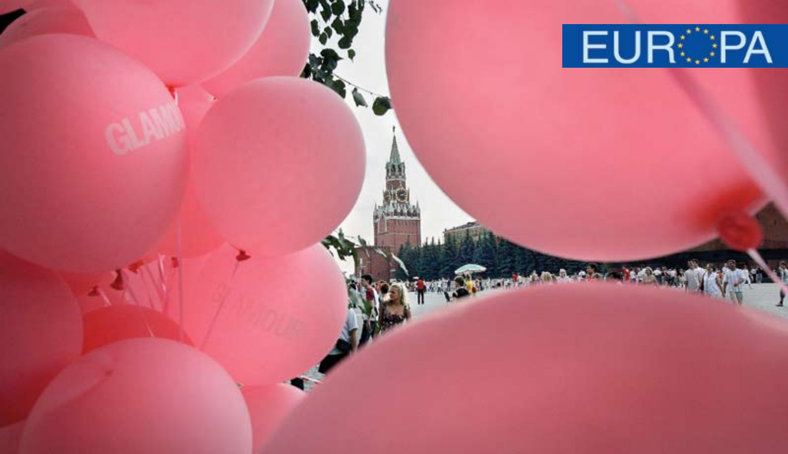
Torre Spasskaya del Kremlin, Moscú.