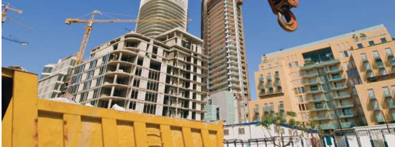
Construcción en Beirut.

Muchos países recortaron drásticamente sus coeficientes de endeudamiento público en el pasado, gracias a las condiciones macroeconómicas favorables. Tal vez no tengan tanta suerte en el futuro