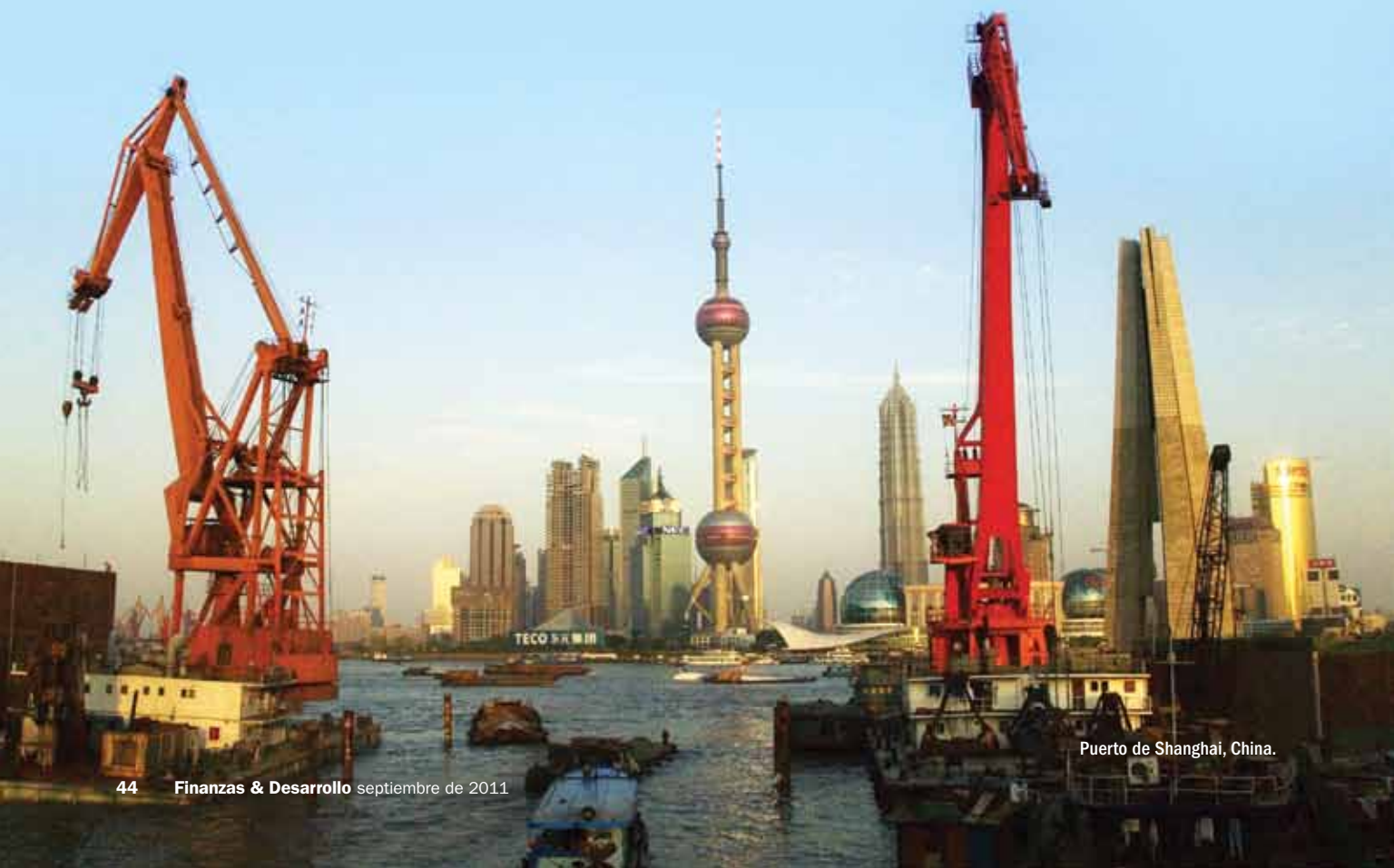
Puerto de Shanghai, China.

Tras la Segunda Guerra Mundial, el comercio mundial registró un crecimiento constante, que se aceleró en la última década: en 2008 el comercio de productos no básicos, especialmente de alta tecnología, como computadoras y artículos electrónicos, aumentó a más del 20% del PIB mundial. La expansión del comercio mundial se ha caracterizado por tres importantes tendencias: el surgimiento de las economías de mercados emergentes como socios comerciales de importancia sistémica; la creciente función de las cadenas mundiales de suministro, y el desplazamiento de las exportaciones de más alta tecnología hacia las economías