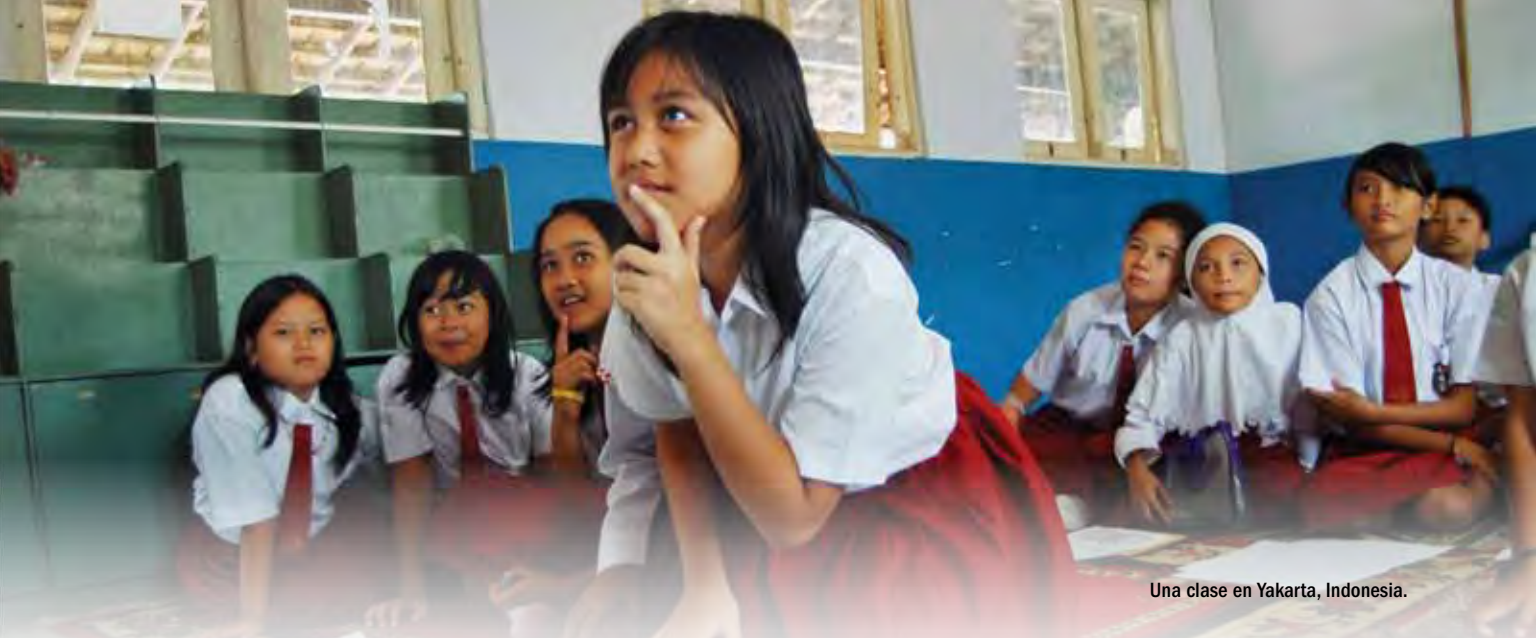
Una clase en Yakarta, Indonesia.

de las políticas de educación que del ingreso (Hanushek y Woessmann, 2008).