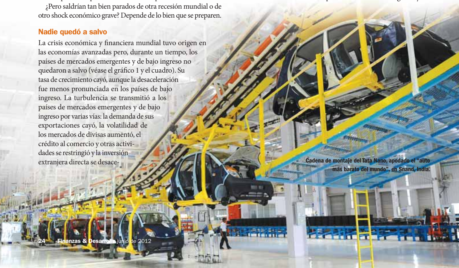
Cadena de montaje del Tata Nano, apodado el "auto más barato del mundo", en Smand, India.

El cambio de la situación fiscal fue especialmente fuerte: la mediana del déficit fiscal de los países de mercados emergentes y