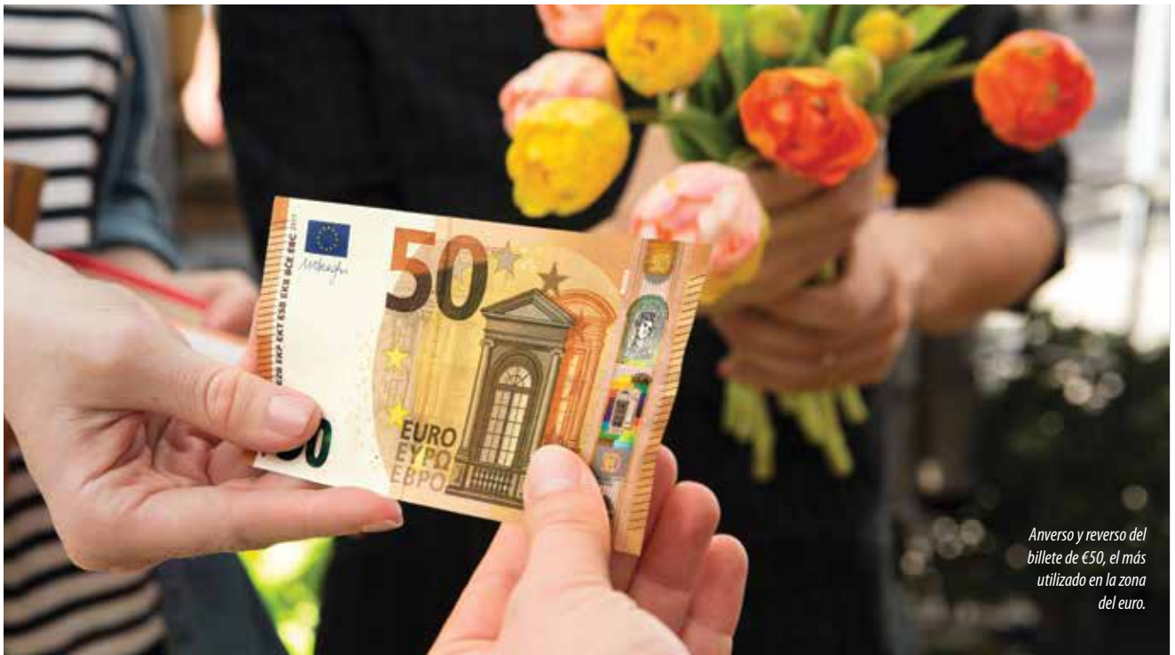
Anverso y reverso del billete de €50, el más utilizado en la zona del euro.