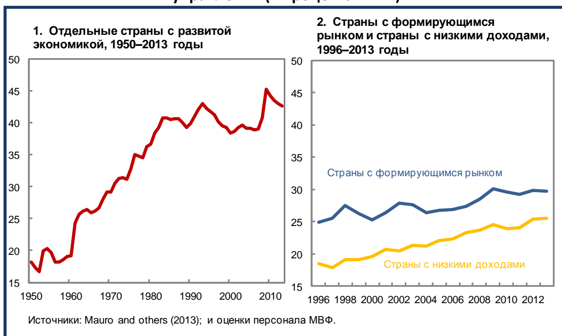
Рисунок 1. Тенденции к повышению расходов сектора государственного управления (в процентах ВВП)

Размер государственных расходов в основном отражает предпочтения конкретных стран в отношении желательного размера сектора государственного управления и объема предоставляемых им услуг. И все же, на протяжении последних нескольких лет, сложилась явная тенденция к повышению доли государственных расходов в общем объеме производства в экономике. Частично это может объясняться фундаментальными экономическими факторами (Рис. 1).