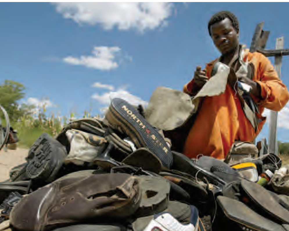
Придорожный сапожник в Хараре, Зимбабве.

Масштабы неформальной деятельности могут также варьировать между секторами в зависимости от характера деятельности. Например, сфера услуг, таких как мелкая/уличная торговля и услуги на дому, и сельскохозяйственное производство для собственных нужд могут быть полностью неформальными, не требуя высоких затрат капитала и/или высокой квалификации. Трудоемкое производство может быть глубоко неформальным. В то же время деятельность, требующая