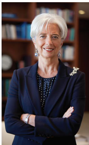
Кристин Лагард — директор-распорядитель МВФ.

П ОСЛЕ перипетий последних пяти лет и глубокого и широкого кризиса (отчасти вызванного глубокими глобальными взаимосвязями экономики стран и финансовых рынков) легко потерять из виду выгоды интеграции. Этого нельзя допустить.