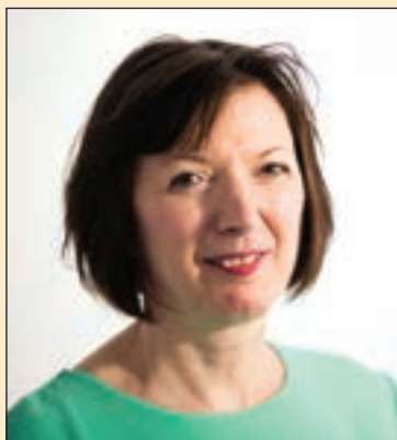
Фрэнсис О'Грейди — генеральный секретарь Конгресса профсоюзов Соединенного Королевства.

Однако в этот период не только увеличивался трансграничный объем торговли товарами и услугами — также значительно возросло трансграничное движение капитала. Многие