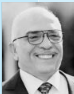
Le roi Hussein de Jordanie

Michel Camdessus, Directeur général du FMI, a exprimé ses condoléances à l'occasion du décès du roi de Jordanie. Voici le texte de la note d'information 99/6, diffusée le 7 février.