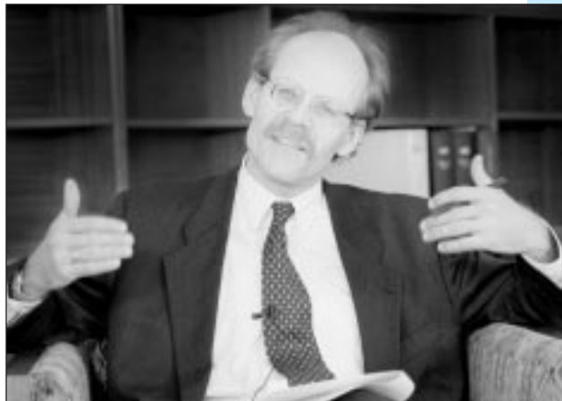
M. Ingves : Il est très dur d'établir des normes sans consulter les autres. Il faut se rencontrer pour parler de ce qui semble raisonnable.

M. INGVES : Il y a quelque chose dans le processus de l'UEM qui tend à rendre les gens sceptiques. J'ai prononcé plus de cent discours ces deux ou trois dernières