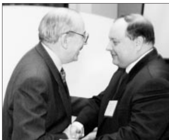
À la séance d'ouverture, M. Camdessus (à gauche) accueille M. Gaidar, ex-Premier ministre de Russie.

et de longue haleine, celle de faire de l'État un secteur moderne et efficace et de mettre en place les institutions de soutien à l'économie de marché. (voir page suivante)