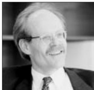
M. Ingves, Directeur du Département de la monnaie et des changes.

Stefan Ingves, de nationalité suédoise, a pris ses fonctions de Directeur du Département de la monnaie et des changes (DMC) le 4 janvier 1999 (voir Bulletin du FMI, 9 novembre 1998, page 348). Précédemment Premier Gouverneur adjoint de la Banque de Suède, il a en outre