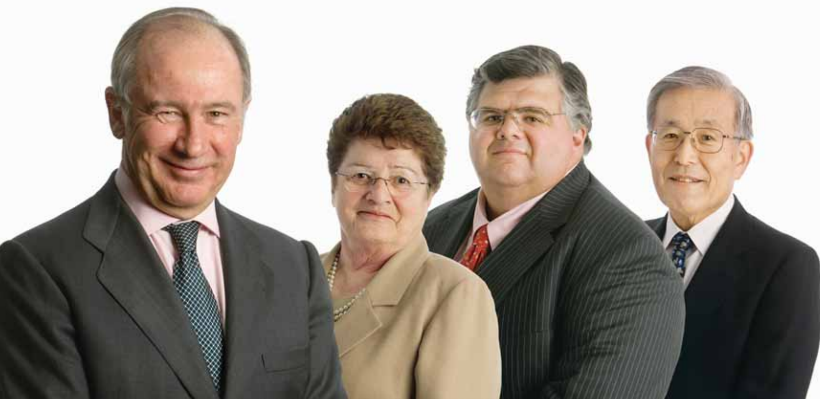
La gerencia del FMI, de izquierda a derecha: Rodrigo de Rato, Director Gerente y Presidente del Directorio Ejecutivo Anne O. Krueger, Primera Subdirectora Gerente Agustín Carstens, Subdirector Gerente Takatoshi Kato, Subdirector Gerente