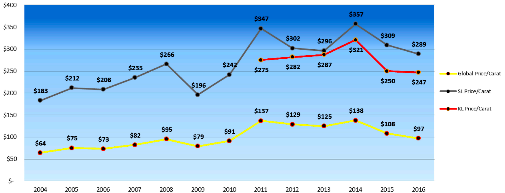
Sierra Leone - KPC and Koidu Limited Data Utilized