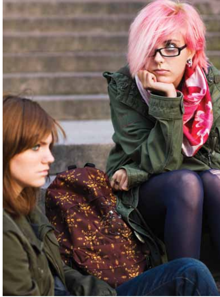
مراهقتان في مدينة ستوكهولم السويدية

وتواجه الصحة السكانية مخاطر في المستقبل. فشباب اليوم - وهم عمالة الغد - لن يكونوا بالضرورة أكثر صحة وإنتاجية من آبائهم. فتراجع النشاط البدني (نتيجة للتوسع الحضري والتحول نحو مهن أقل تحركاً) وتزايد أعراض البدانة واستهلاك الكحول والتبغ يندران بتزايد الأمراض غير المعدية مثل مشكلات القلب والأوعية الدموية، ومرض السكري، والسرطان. أما تراجع مستوى الاستقرار- في المنزل والعمل - فله انعكاسات سلبية على الصحة الوجدانية والعقلية لشباب العالم. وثمة إشارات يصدرها تزايد نسبة المراهقين والشباب إلى السكان تدل على زيادة الطاقة الإنتاجية للاقتصاد المعني على أساس حصة الفرد في السنوات القادمة واحتمالات تحقق مكسب ديمغرافي، أي فرصة سانحة محدودة المدة لتحقيق نمو سريع في الدخل والحد من الفقر (دراسة Bloom 2011). وهذه الفرصة، التي تظل سانحة ما دامت حصة السكان في سن العمل مرتفعة نسبياً، تفرض أيضاً مخاطر زعزعة الاستقرار الاجتماعي والسياسي في الاقتصادات التي تخفق في توليد فرص عمل كافية.